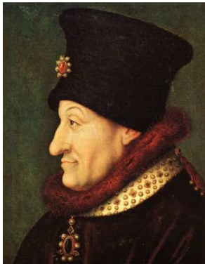
Philips de Stoute, Philippe le Hardi, Philipp the Bold, Philipp der Kühne Onbekende meester. 16e eeuw, Versailles.

Het plotse overlijden van Filips de Stoute bracht het reisgezelschap enigszins in verlegenheid. De hertog bleek namelijk niet genoeg geld bij zich te hebben om de lopende onkosten te betalen. Zijn zonen moesten tafelzilver verpanden en zijn weduwe Margareta legde beschaamd haar beurs, sleutelbos en gordel neer op de lijkst, een symbolisch gebaar waarmee zij afstand deed van haar rechten op zijn aardse bezittingen. De Halse middenstanders verkozen wijselijk eieren voor hun geld. Uiteindelijk was een kartuizersklooster in het naburige Herne bereid een pij te bezorgen, waarin Filips begraven wenste te worden. Na zijn dood werd zijn lichaam naar Brussel overgebracht waar men zijn lichaam gedurende enkele weken voorbereidde en het balsemde. Vervolgens werd het lichaam van Filips de Stoute, stichter van de Bourgondische Valoisdynastie en machtigste vorst van Europa, begraven in de crypte van het kartuizersklooster van Champmol. Tot de Franse Revolutie zou hij daar rusten in de weelderige tombe die hij voor zich had besteld bij Claus Sluter, tot heden een der mooiste verwezenlijkingen van de Bourgondische kunst. Zijn gebalsemd hart werd bijgezet in de kathedraal van Saint Denis bij Parijs en zijn ingewanden werden begraven in de crypte van de Sint-Martinuskerk te Halle.