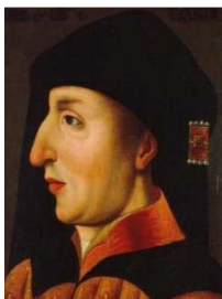
Portrait de Philippe II, dit « le Hardi », école flamande, XVI e siècle, musée de l' hospice Comtesse , Lille .

Meer afbeeldingen in map bourgondië (in map geschiedenis-zevende-klas-deel-2).