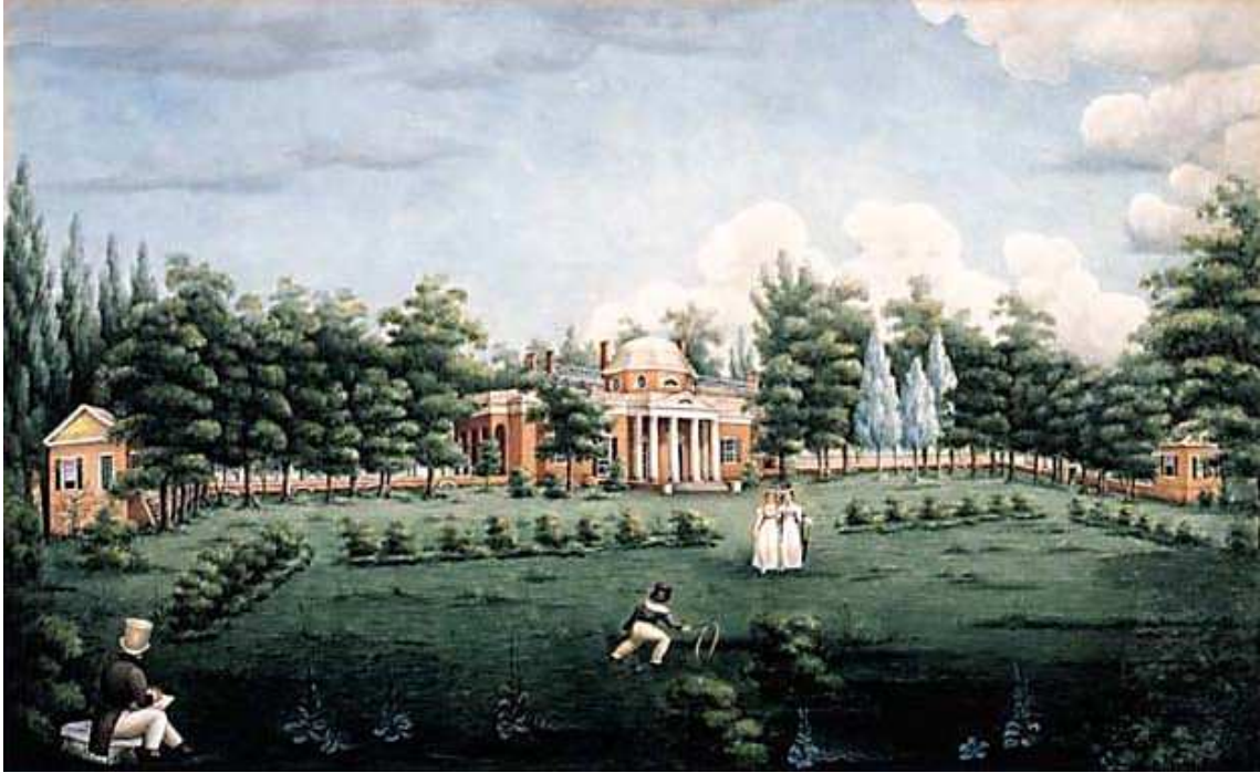
Thomas Jefferson, Monticello in Virginia