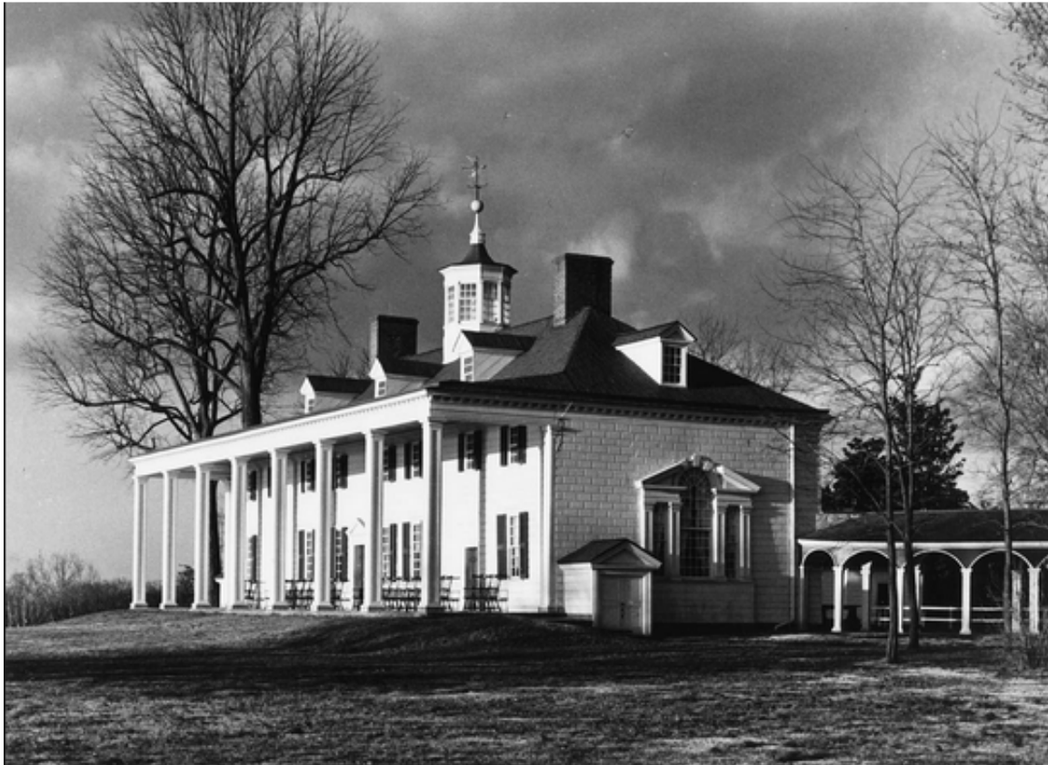
George Washington, Mount Vernon (Virginia).