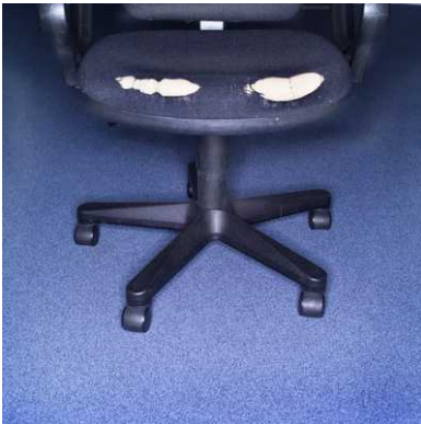
De klassieke zitstoel: niet langer de norm, als het van RAAAF afhangt.