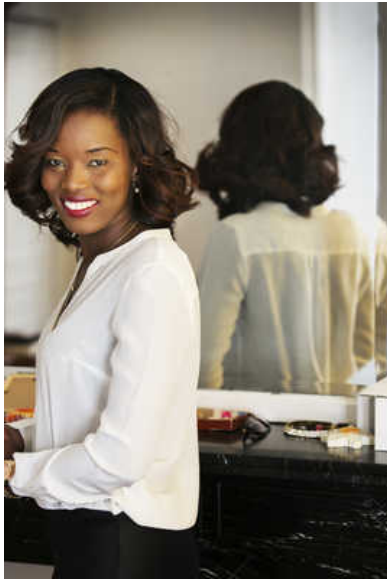
► Assita Kanko groeide op in Burkina Faso. In 2001 emigreerde ze naar Nederland en in 2004 naar België. Zij is MR-politica, columniste en auteur.