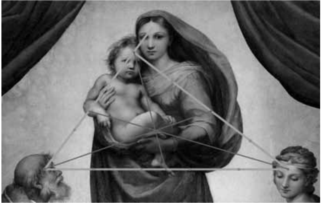
Fig. 1 – de Pythagoreïsche drie- hoek in de Sixtijnse Madonna

loop in vijf ongeveer gelijke delen is zeer uitzonderlijk. Veronderstel dat bronnen bestaan waarin wordt gesteld dat het leven van Jezus inderdaad door zo'n zeldzame vijfdeling werd gekenmerkt. In dat geval wordt de overeenkomst tussen het beeld op het schilderij (het vijfgedeelde lijnstuk met de erop geplaatste voet) en de veronderstelde betekenis (de equi-partitie van Jezus' levensloop) zeer specifiek. Door deze specificiteit zou het logisch rechtmatig worden om de niet-toevalligheid van genoemde overeenkomst als onderzoekshypothese in te voeren.